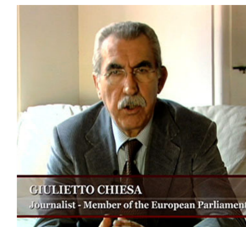
GIULIETTO CHIESA Journalist - Member of the European Parliament

L'impresa è sicuramente ardua, ma siamo fiduciosi: alle riunioni che facciamo a Rimini ci ritroviamo ogni volta in circa 80, alcuni dei quali fanno 80 km per venire... se pensi che alle riunioni di partito si contano sulle dita di una mano! Per i progetti l'estate ha rallentato ogni attività, ma a breve da Roma metteranno online il sito internet, e verrà divulgato lo spot nazionale (sia in youtube, che sul sito di Pandora, che sulle tv del network) col quale si cercherà di reperire nuovi aderenti. Inoltre faremo diverse iniziative per raggiungere la soglia di 10.000 aderenti che ci si è dati. Da settembre a dicembre lavoreremo duro, perché vogliamo iniziare con le programmazioni fin dal gennaio prossimo. Seguitemi.