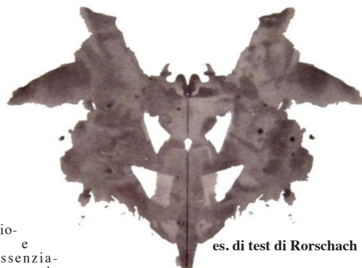
es. di test di Rorschach

La costruzione di un test psicometrico si basa, dunque, oltre che su presupposti misurazionisti , anche sull'assunzione del principio statistico della normalità della distribuzione di frequenze. Il primo presupposto consente di guardare il fenomeno psichico come una variabile, cioè come una caratteristica