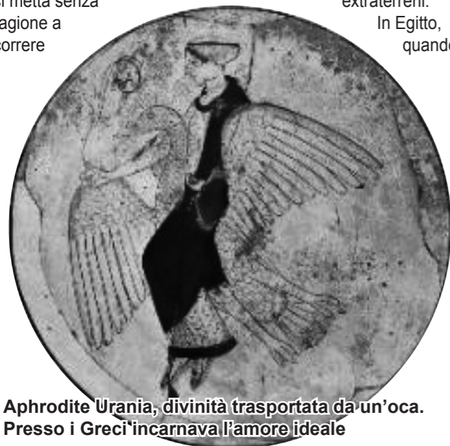
Aphrodite Urania, divinità trasportata da un'oca. Presso i Greci incarnava l'amore ideale

La scelta di Oasiverde non è tra l'oca di ieri e quella di oggi: la nostra scelta è costruire un rapporto con animali che hanno una storia, un'esigenza, ma anche una forte personalità capace di andare oltre a quei muri che il folklore e la zootecnia hanno innalzato.